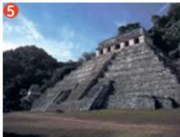
▲ Palenque (675 d. C.). Chiapas, México.