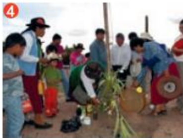
▲ Ofrenda a la Pachamama, en Coctaca provincia de Jujuy, Argentina.