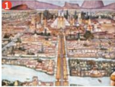
▲ Detalle de la pintura de Diego Rivera, La gran Tenochtitlan (1945).

I.-Observa las imágenes y luego responde: