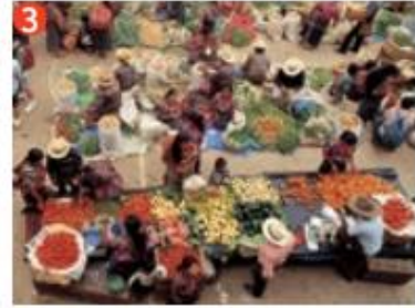
▲ Mercado de Chichicastenango, Guatemala.