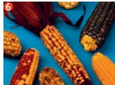
▲ Maíz americano.

En los recuadros siguientes, describe cada imagen y señala a qué civilización(es) la asocias. Luego explica lo que sabes sobre el objeto, lugar o situación reflejada.