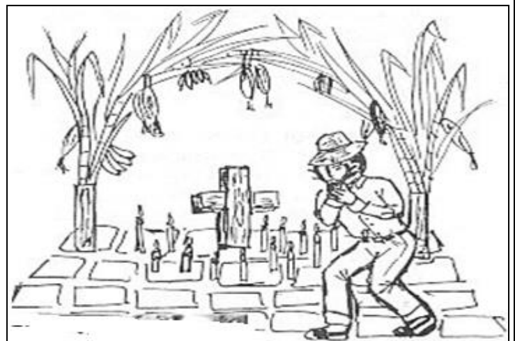
CRUZ DE MAYO

4.- Dibuja dos festividades aymara que tu conozcas.