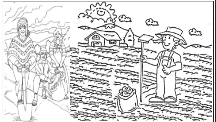
SIEMBRA DE LA PAPA