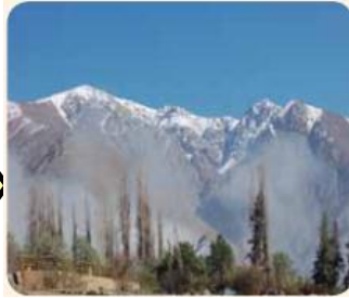
Cordillera y Montaña.

Relieve: Se refiere a las formas y alturas de la superficie de un territorio. Pueden ser: planicies litorales, valles, cerros, montañas, volcanes u otros.