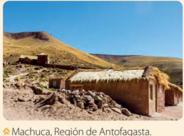
Machuca, Región de Antofagasta.

1.- Observa la imagen y luego describe el paisaje considerando: