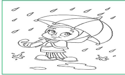
Tiempo de lluvia