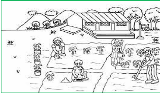
Tiempo de siembra