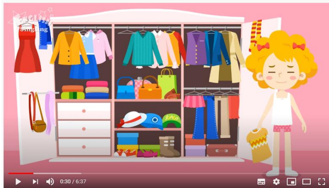
Kids vocabulary - Clothes - clothing - Learn English for kids - English educational video

https://www.youtube.com/watch?v=Q_EwuVHDb5U