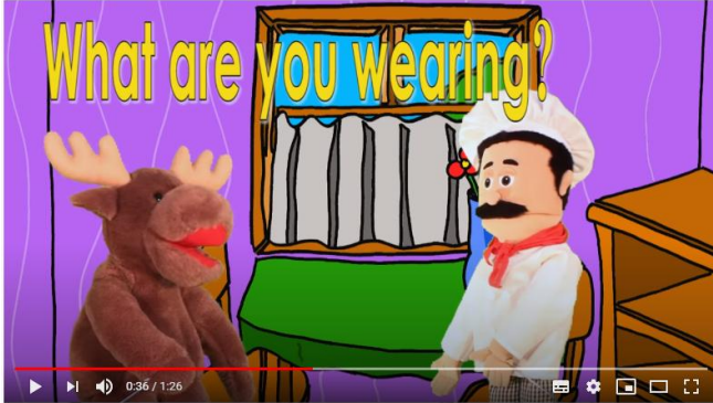
What Are You Wearing? - Simple Skits

https://www.youtube.com/watch?v=h6CvRv-AH2Y